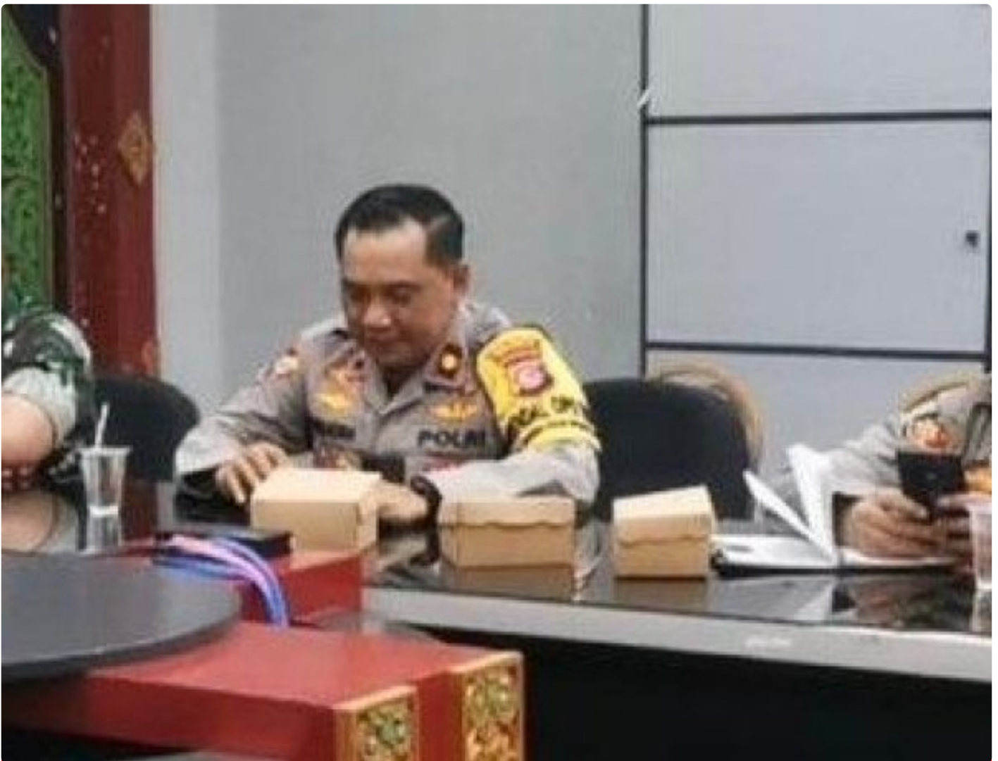
Kabagops Polresta Mataram saat menghadiri Rakor di Kantor Bupati Lombok Barat, Selasa (10/12/2024)

MATARAM, NTB – Dua tradisi budaya ikonik, Pujawali dan Perang Ketupat, akan